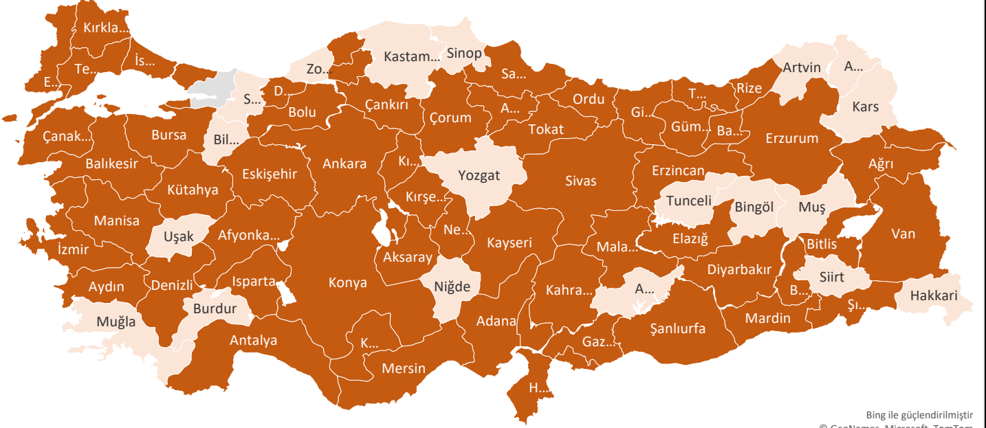
Harita 1. Hapishanelerden İHD'ye Başvuru Yapılan İllerin Haritası